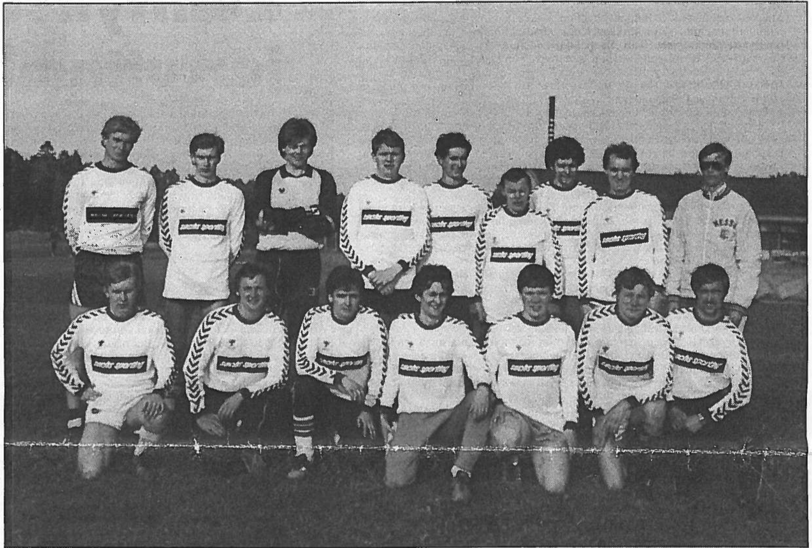
80-LUVUN KILO. Kilo IF:ssä pelaa neljä miesten edustus- ja yksi ikämiesjoukkue. Tässä kuvassa tyylittelevät Kilon urhot joskus 80-luvun puolivälistä.

-Edustusjoukkueessa ovat selkeästi parhaat pelaajamme, ellei sitten joku halua esimerkiksi tunne-tyylinä pelata jossakin kol-